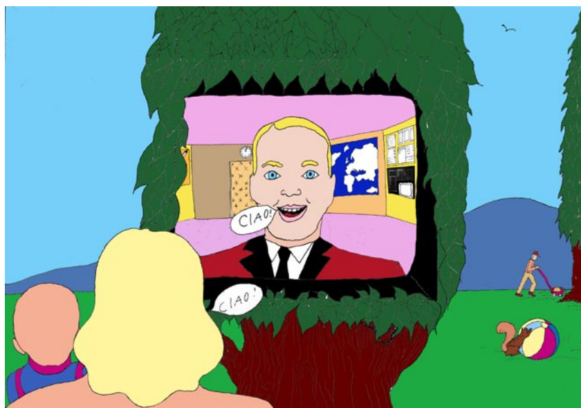
Pushwagner "PLING PLONG" Maleri